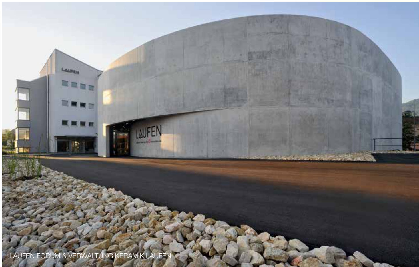
LAUFEN FORUM & VERWALTUNG KERAMIK LAUFEN

Wir freuen uns, Sie in Laufen zu begrüßen.